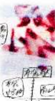
夏限定 ソフトワッフル・ピエゼ 杏仁のソフトワッフル 同の果物