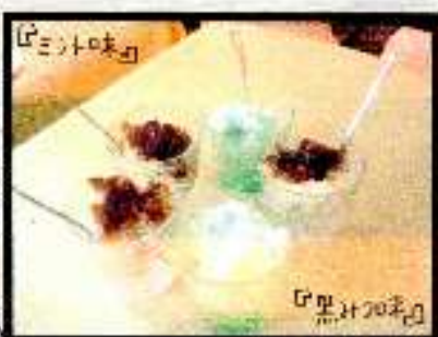
味汁ミロ 黒汁ミロ ココロミロ

夏限定のワッフル・ピエゼの ★主な味やコーヒータンなど まき前に合わせて呼び名も バズリ